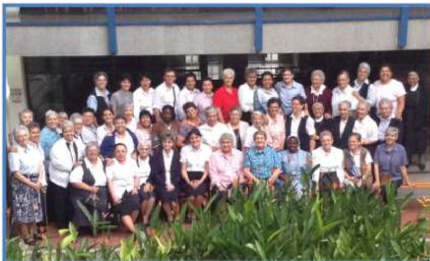
Religiosas de Estados Unidos, Perú y Colombia, participantes en el Encuentro con el Equipo General. Foto en la Comunidad de Landirás, Medellín. Febrero 23 de 2014

La fecha oficial para la iniciación de la Provincia será el próximo 7 de abril, día especial para la Compañía de María.