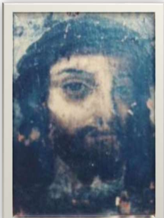
Retablo del Divino Rostro, estado actual, Comunidad de Nuestra Señora, Bogotá, 2014. Agradecimientos a Nora Tascón de la Pava, ondn.

Un día, en la recepción del Convento de la Compañía de María Nuestra Señora, en Bogotá, cuando existía todavía la clausura Papal Mayor, se presentó un niño pequeño y dijo en el torno: Hermanita, aquí le traigo esta tablita para que me haga el favor de guardármela." Luego se despidió y al parecer salió corriendo como lo hacen los pequeños.